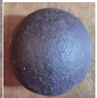
CG "8 Libbre"