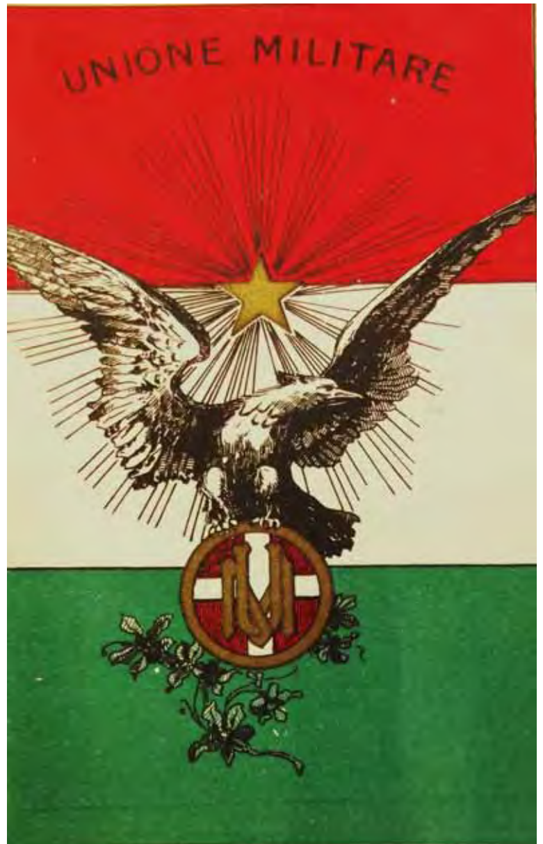
Cartolina fine ottocento dell'Unione Militare, negozio specializzato in articoli militari, soprattutto per le uniformi da Ufficiale.

Il 9 marzo 1873 dunque le Compagnie alpine vennero raccolte in 4 reparti comandati ciascuno da un maggiore che fece parte del personale dei Distretti.